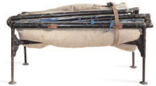
Lit de camp pliable (35x70x23 cm).