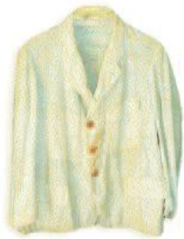
Chemise de toile écrue.