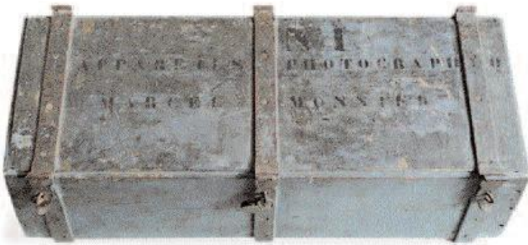
Cantine pour le transport du matériel photographique (20x80x35 cm).