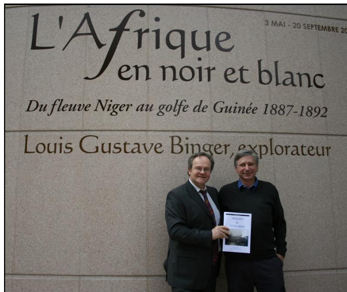
A L'Isle-Adam, le 2 mai 2009.