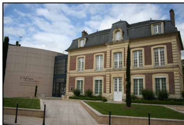
Le Centre Jacques-Henri Lartigue.