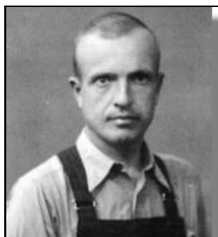
Michel Leiris vers 1930.