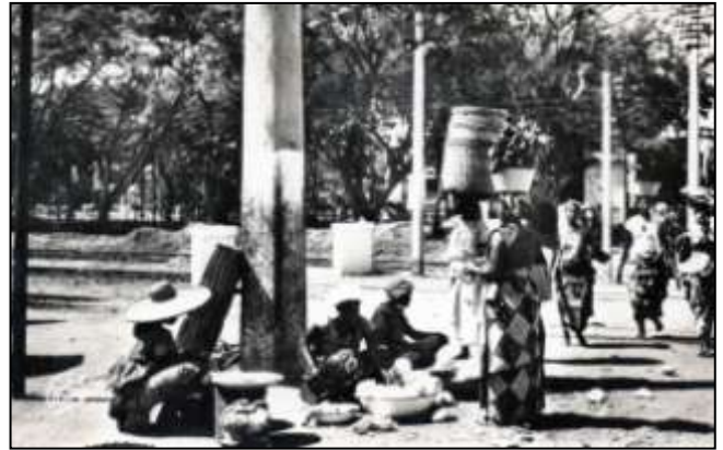
3 - LOMÉ (Togo) - Un coin du Petit Marché