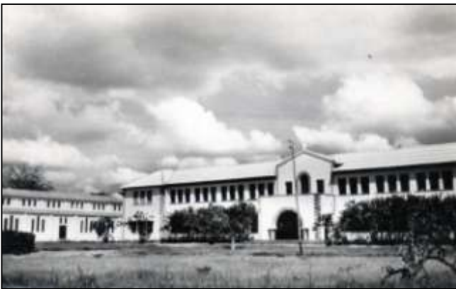
9 - LOMÉ (Togo) - Le Collège Saint-Joseph