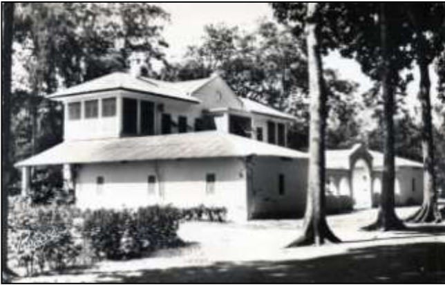
2 - LOMÉ (Togo) - Le Service d'Hygiène