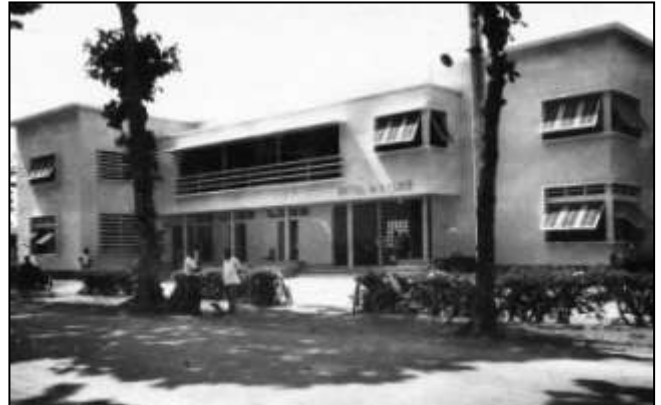
18 - LOMÉ - L'Hôtel de Police