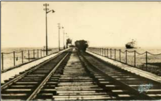
13 - LOMÉ (Togo) - Le Wharf