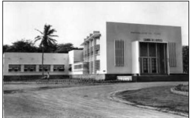
14 - LOMÉ - Chambre des Députés