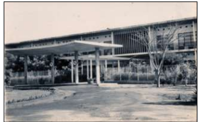
12 - LOMÉ - Entrée de l'Hôpital de Tokoin