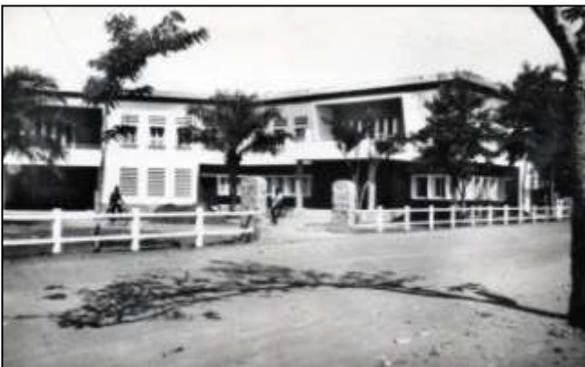
17 - LOMÉ - Caisse des Prestations Familiales