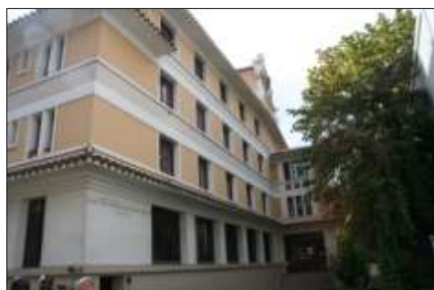
La Maison de l'Asie du Sud-Est