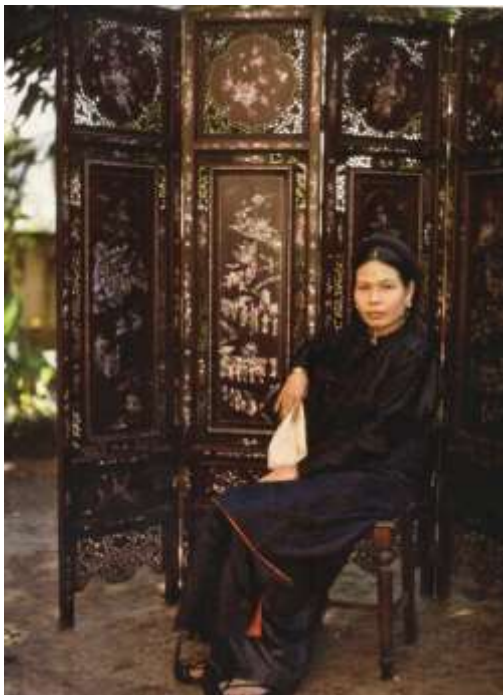
▲ Portrait de femme d'un interprète de classe aisée

La pipe à eau ressemble à une pipe à bol. Le bol, en faïence ou en porcelaine, est revêtu d'une protection en bois. La tige de bambou aspiratrice de la fumée de tabac peut atteindre 1,5 mètre de longueur selon l'importance du mandarin qui en a l'usage.